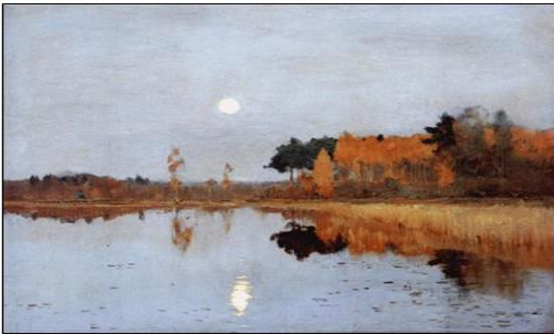
И. Левитан. Сумерки. Луна

4. Определи название музыкального произведения, которое созвучно данным произведениям искусства. Обведи букву правильного ответа.